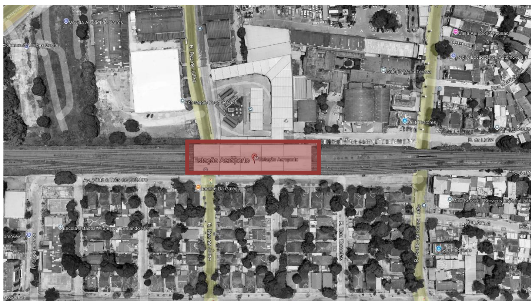
FIGURA 1 – ESTAÇÃO AEROPORTO